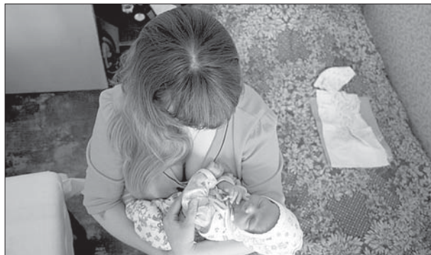
Один из новых десяти тысяч

С начала года в нашей области родился 10151 человек. Это на 106 малышей меньше, чем за аналогичный период 2012-го. Стало быть, рождаемость падает. Хотя по моим бытовым наблюдениям, Архангельск переживает настоящий бэби-бум: многие знакомые собралась рождать второго, третьего... Но статистике, ко-