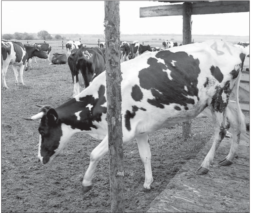
Из ВВП «уходит» сельское хозяйство...