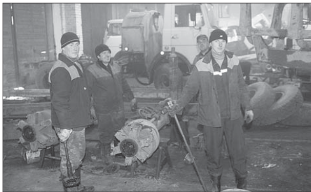
Свои надбавки северяне добывают тяжелым трудом...

Другими словами, минимальные гарантии по оплате труда работников будут снижены. Это повлечет общее сокращение размеров оплаты труда. И платить низкую заработную плату можно будет на