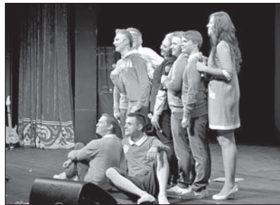
Выступает команда «Поморье»

В игре также приняли участие команды Балтийского федерального университета имени Иммануила Канта – сборная БФУ имени И. Канта (Калининград), Южного федерального университета – женская сборная ЮФУ «Ррр» (Ростов-на-Дону), Уральского федерального университета имени первого президента России